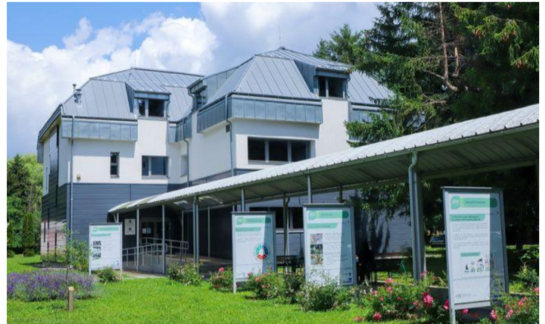
Pannon Egyetem, Egyetemi Könyvtár és Tudásközpont Zalaegerszegi Tagkönyvtár